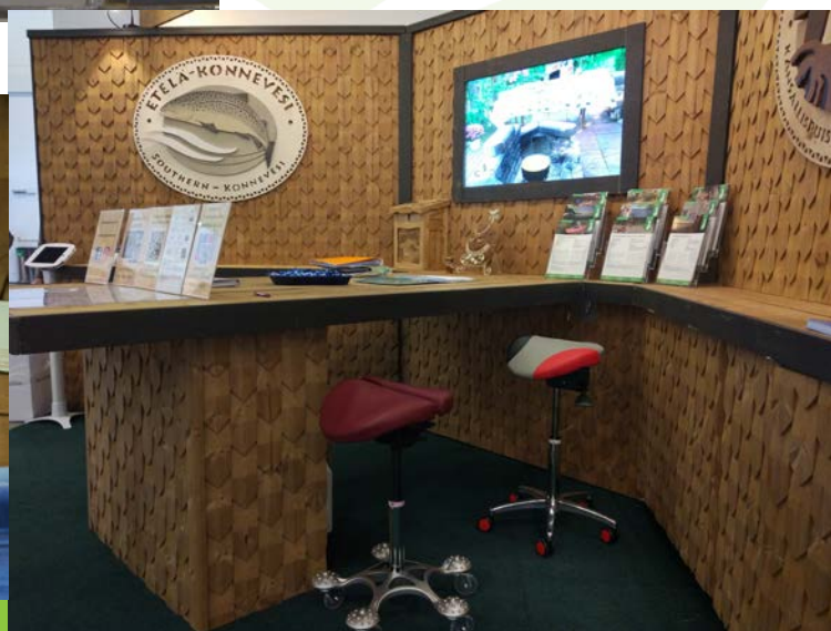
Kiehtova maisema -hanke 30.1.2018